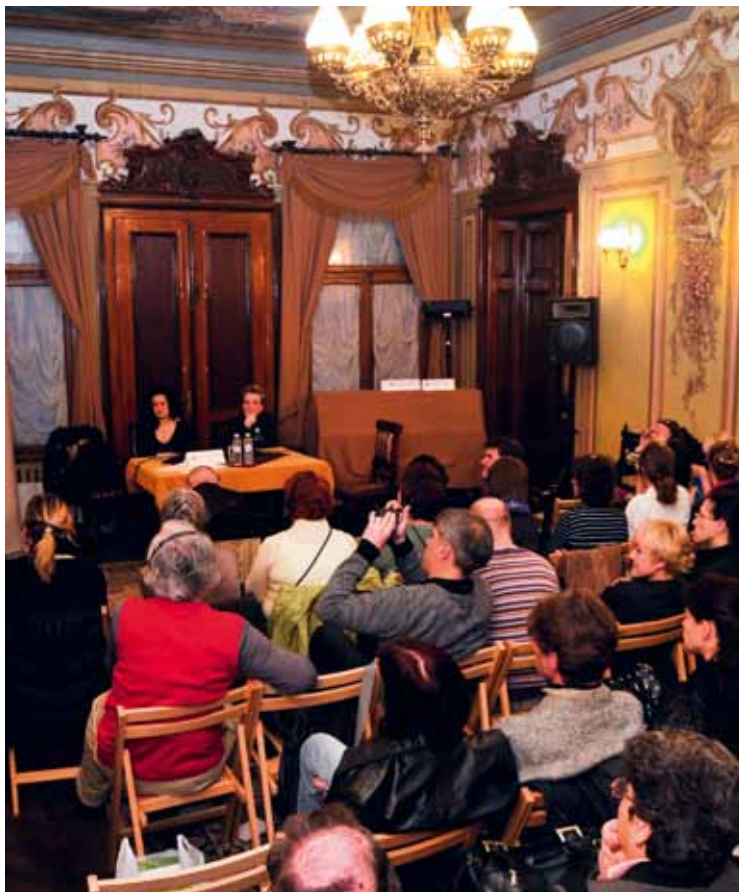
Literarischer Frühjahrssalon der Canetti Gesellschaft und der Stadt Ruse 2010