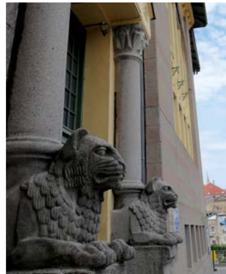
Oben: Eingangshalle des Jungen Theaters Mostar

Kinder- und eine Jugendtheatergruppe und pflegt enge Beziehungen zu der Fakultät für Darstellende Künste der Universität Džemal Bijedić Mostar. Viele Schauspieler aus dem ganzen Land, die heute zu internationaler Bekanntheit gelangt sind, sind dem Jungen Theater seit ihren Anfängen verbunden.