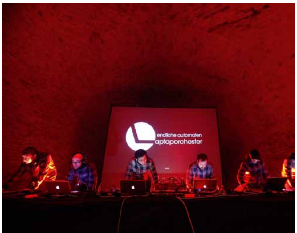
Konzert des Laptoporchesters in Osijek auf der Kompositionsreise durch Mittel- und Südosteuropa